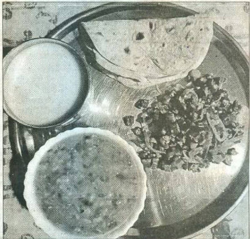
अब साधारण खाने-पीने का ट्रेड जोर पकड़ने लगा है। एक्सपर्ट्स का मानना है कि यह शरीर के लिए तो अच्छा है ही, पर साथ ही दुनिया को भी इससे बहुत फायदा हो सकता है।

में समाप्त होने वाली के इंडेक्स में वर्चस्व के बिना, एग्रीडेक्स में स फ्यूचर्स संविदा 26 कमोडिटी बार तथा सेक्टर बार फ्लोर तथा लिए उपलब्ध होंगी। कम्प है। एग्रीडेक्स का अन्य आस्ति वर्गों तथा नी घोषणा करते हुए इंडाइसेस के साथ बहुत कम सहसंबंध है। निदेशक एवं सीईओ, विविधता सुनिश्चित करने के लिए इंडेक्स में कहा कृषि भारतीय कोई भी कमोडिटी संबद्ध समूह 40 प्रतिशत से स्तंभ है तथा रोजगार अधिक का वेटेज संघटित नहीं करेगा। चपूर्ण योगदान देती है। रोलओवर समाप्ति माह के प्रथम 3 दिनों में व भारतीय कृषि वेल्यु प्रबंधन माध्यमों को किया जायेगा और इंडेक्स का अप्रैल के प्रथम म भूमिका निभाई है। पुर्नसंतुलन किया जायेगा। प्रत्येक कमोडिटी के कारोबारी दिन पर वार्षिक आधार पर विदा निवेशकों को वेड्स पर फ्लोर तथा कैप लामू किया जायेगा।